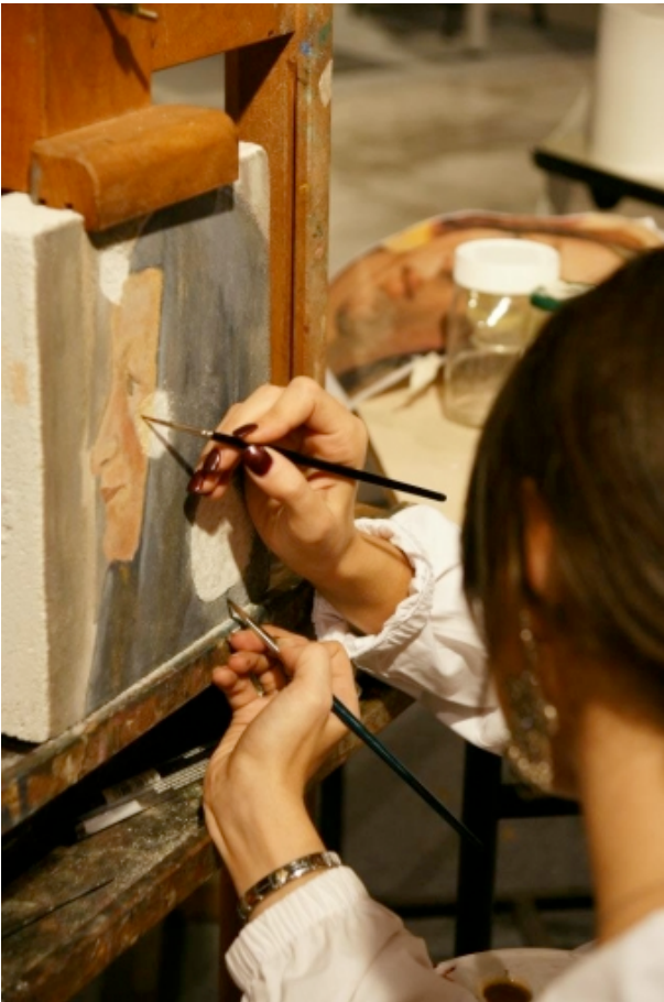
Firenze - “Il Salone dell’Arte e del Restauro di Firenze