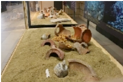
Archaeological Exhibition of Underwater Finds in Barumini