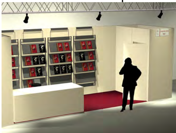
stand 6x2 - un lato aperto