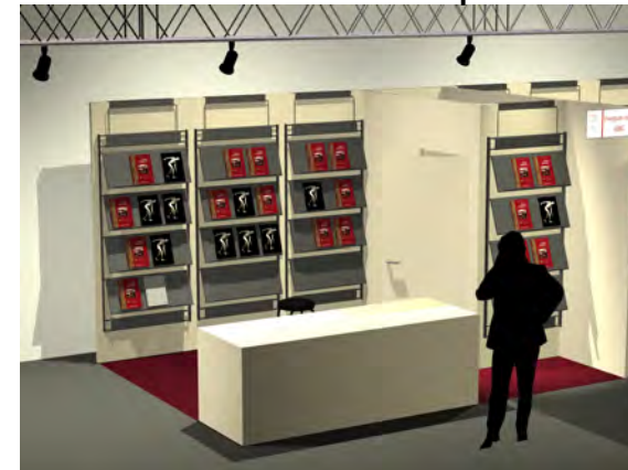
stand 4x3 - due lati aperti