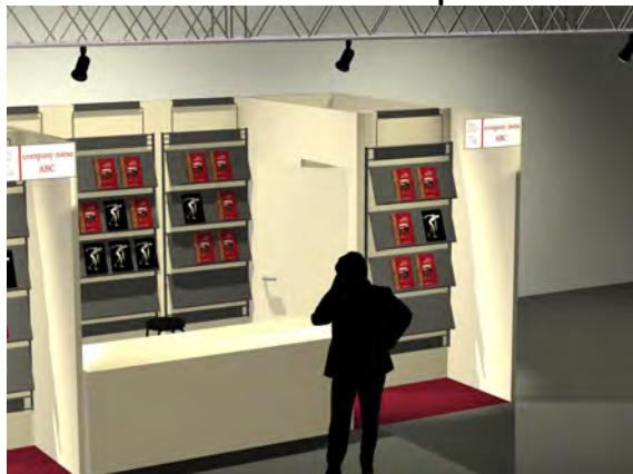
stand 4x3 - un lato aperto