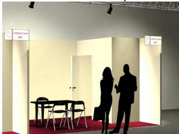
stand 4x3 - un lato aperto