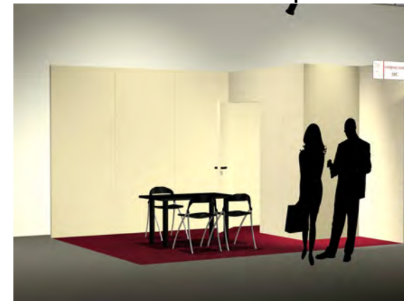
stand 4x3 - due lati aperti