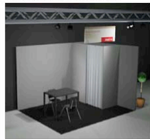
STAND 4 x 3 m - DUE LATI APERTI