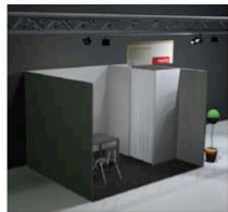
STAND 4 x 3 m - UN LATO APERTO