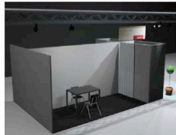
STAND 6 x 2 m - UN LATO APERTO